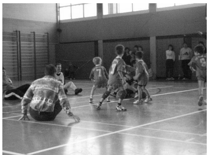
Die Eltern taten sich schwer gegen ihre Sprösslinge