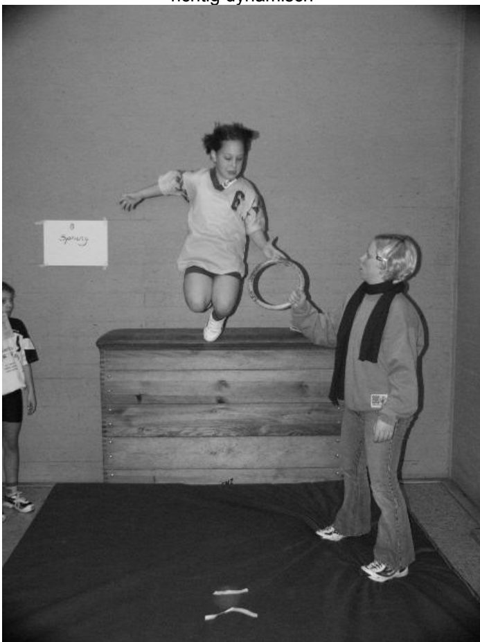
Im Gymnastikraum der Halle wurden auch Geschicklichkeitsspiele angeboten