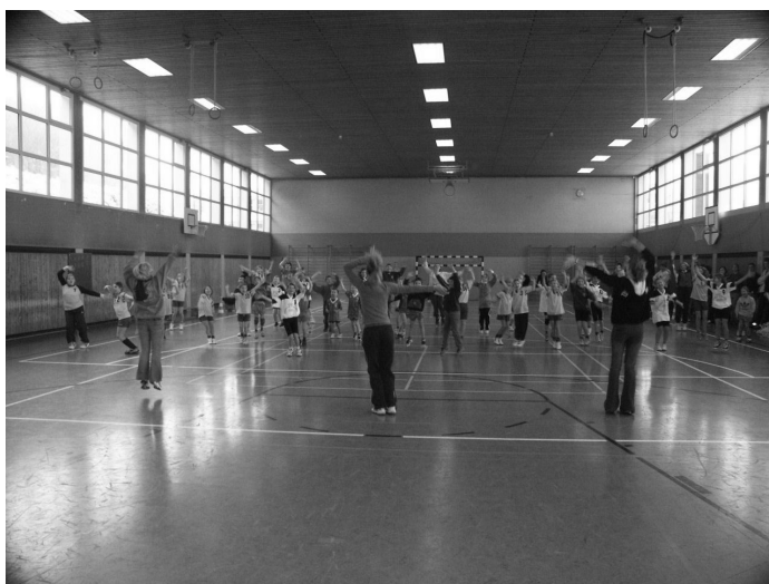
Aerobic – nicht nur zum Frühsport im Zeltlager – auch ein Teil des Aufwärmprogramms