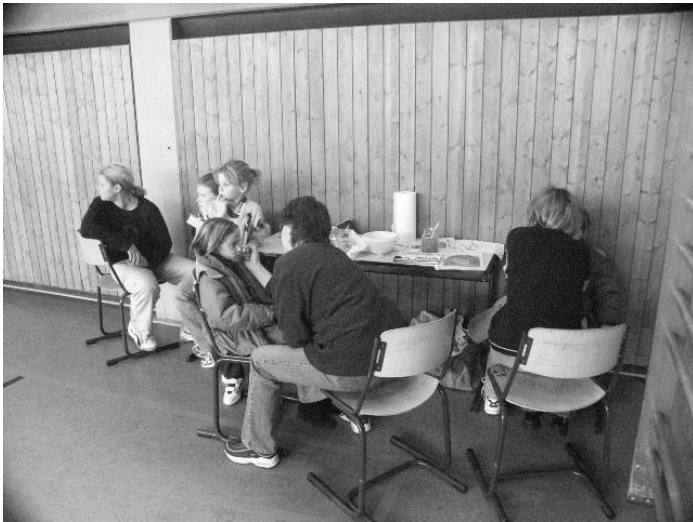
Mit der entsprechenden Maske wird das Spiel erst so richtig dynamisch