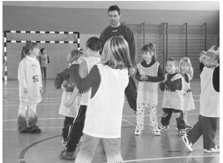
Tiger gegen Löwen - da hatte es ein Schiedsrichter schon schwer, den Überblick zu behalten und zu Wort zu kommen