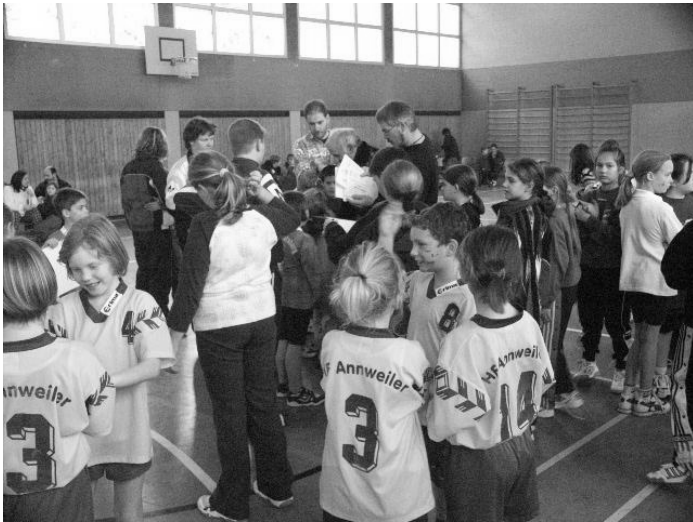
Bei der Siegerehrung