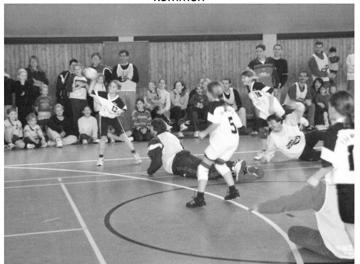
Kids gegen Eltern – mit Handikap