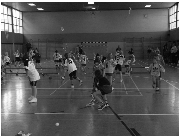
Aufwärmtraining einmal anders!