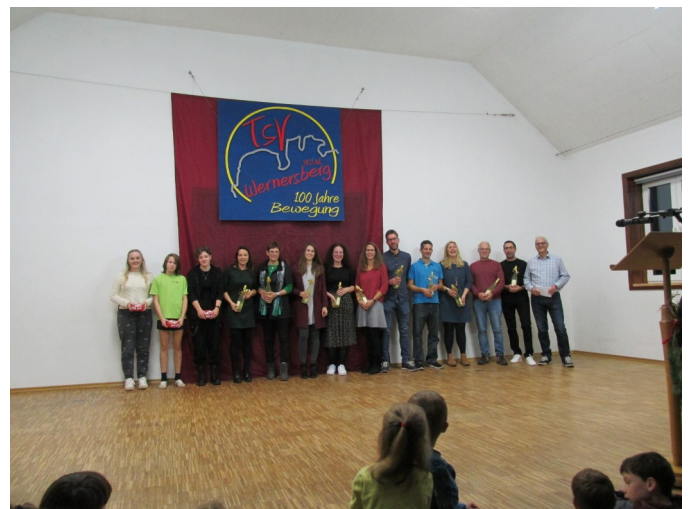
Ein Bild von der Jahresabschlussfeier von unseren fleißigen Handballtrainern und Schiedsrichtern