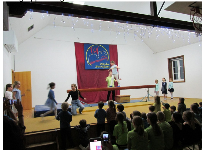
Turngruppe Grundschul Kinder