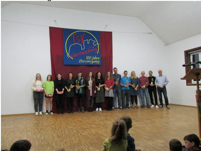
Betreuer und ÜbungsleiterInnen